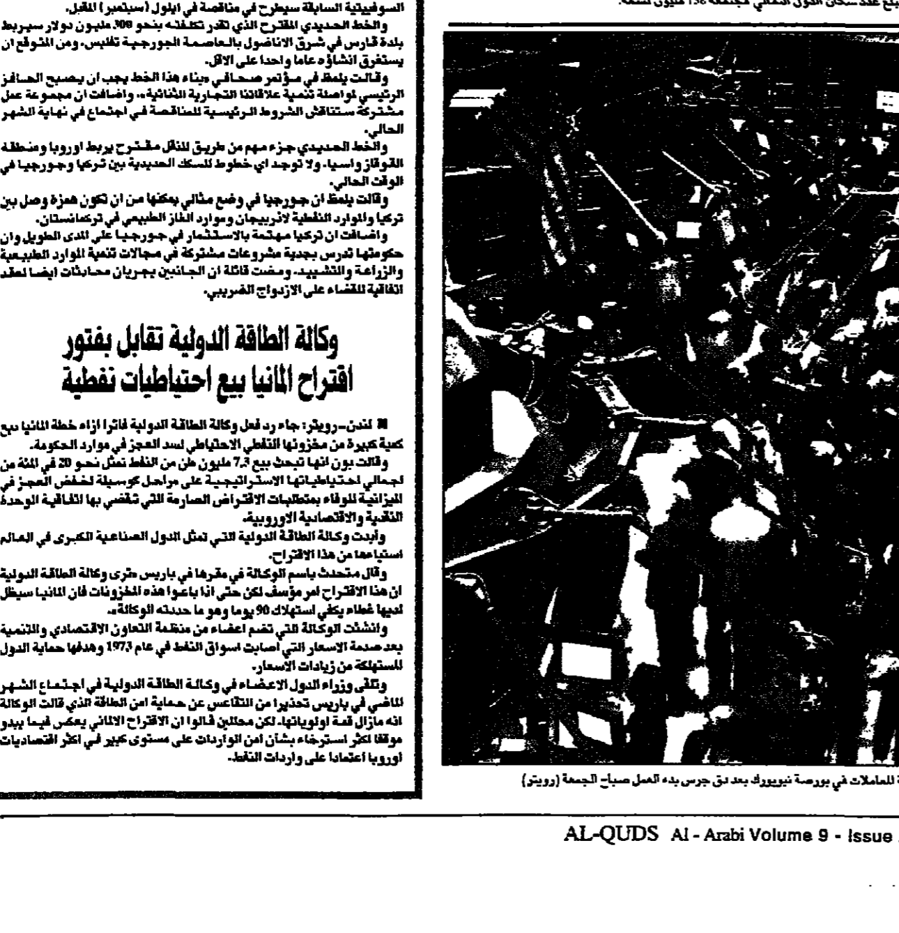
قاعة المصانع في بورصة نيويورك بعد فتح جرس بدء العمل صباح الجمعة